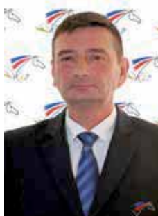
Philippe CÉLÉRIER sélectionneur National de Para-Dressage