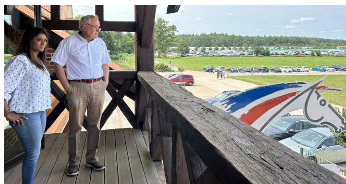
Monsieur Serge Lecomte, Président de la FFE et Madame Prisca Thévenot, alors Députée des Hauts-de-Seine, venue assister aux Championnats de France d'équitation le 10 juillet 2023 au Parc équestre fédéral.

Les Championnats sont également l'occasion de faire découvrir aux élus nationaux et locaux la richesse des activités équestres et d'échanger sur les atouts que représentent celles-ci pour les territoires et leurs habitants. Ces visites sont l'occasion d'aborder les problématiques rencontrées par les poney-clubs et centres équestres dans leurs activités quotidiennes.