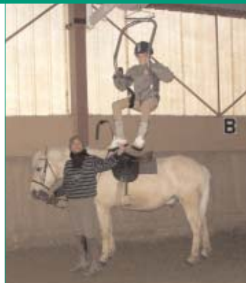
Le handimove au CFE de la Grenadière (37)

Pour pouvoir se présenter à l'examen, il faut suivre une formation comprenant deux modules théoriques de deux jours chacun et un stage de mise en situation pédagogique d'une durée minimale de deux jours dans un centre agréé. Deux valences ou mentions, éventuellement cumulables, sont pro-