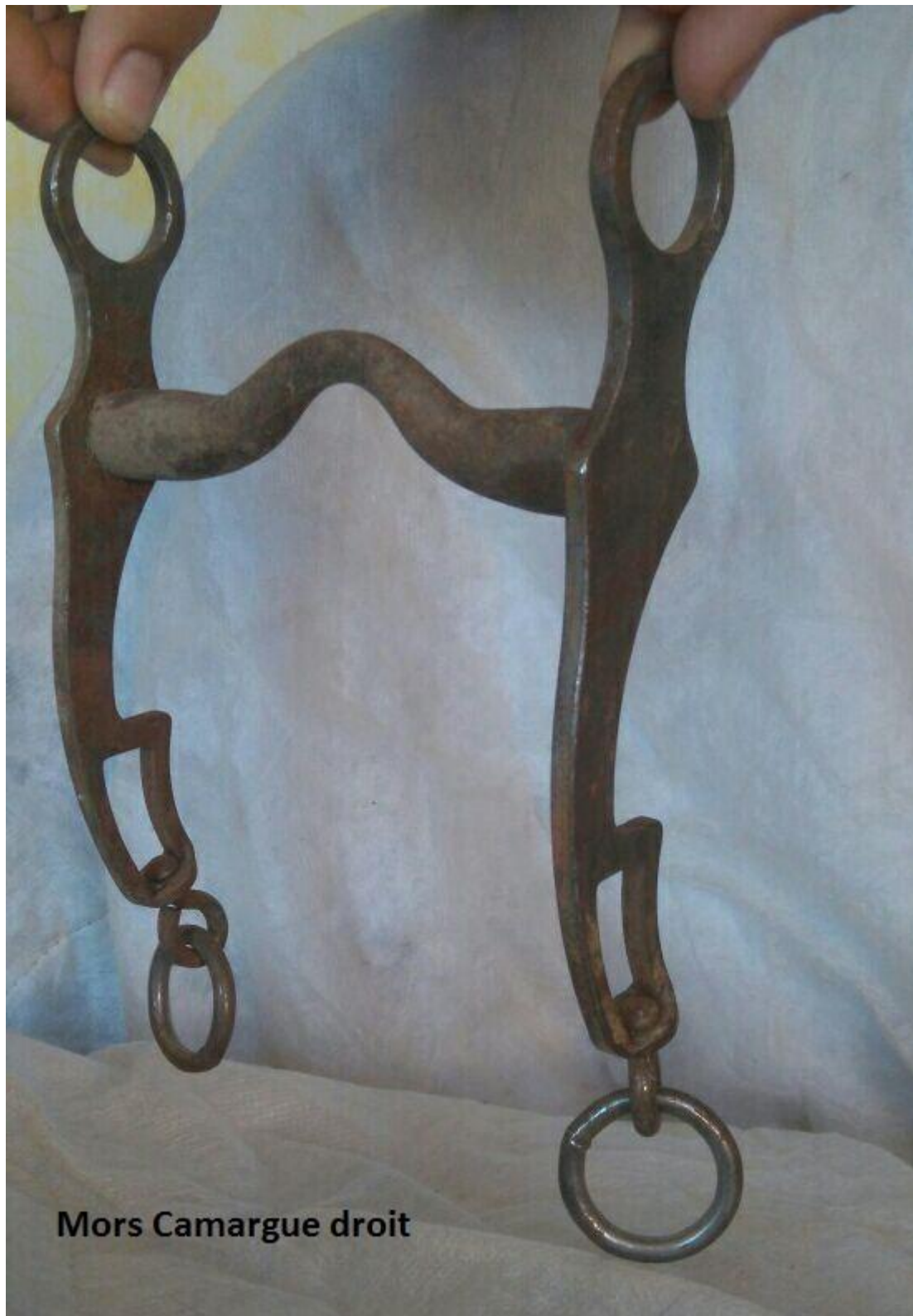
Mors Camargue droit