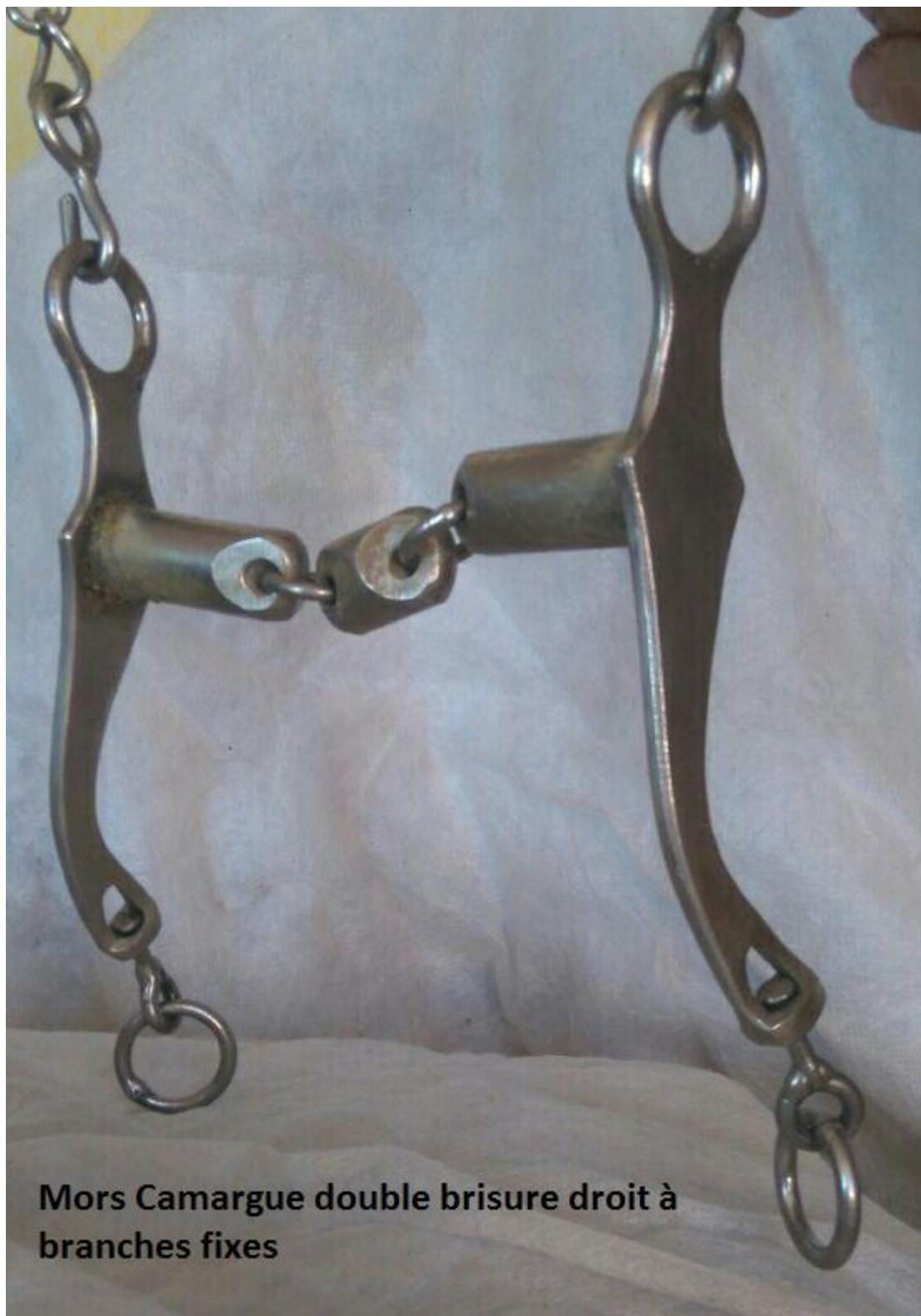
Mors Camargue double brisure droit à branches fixes