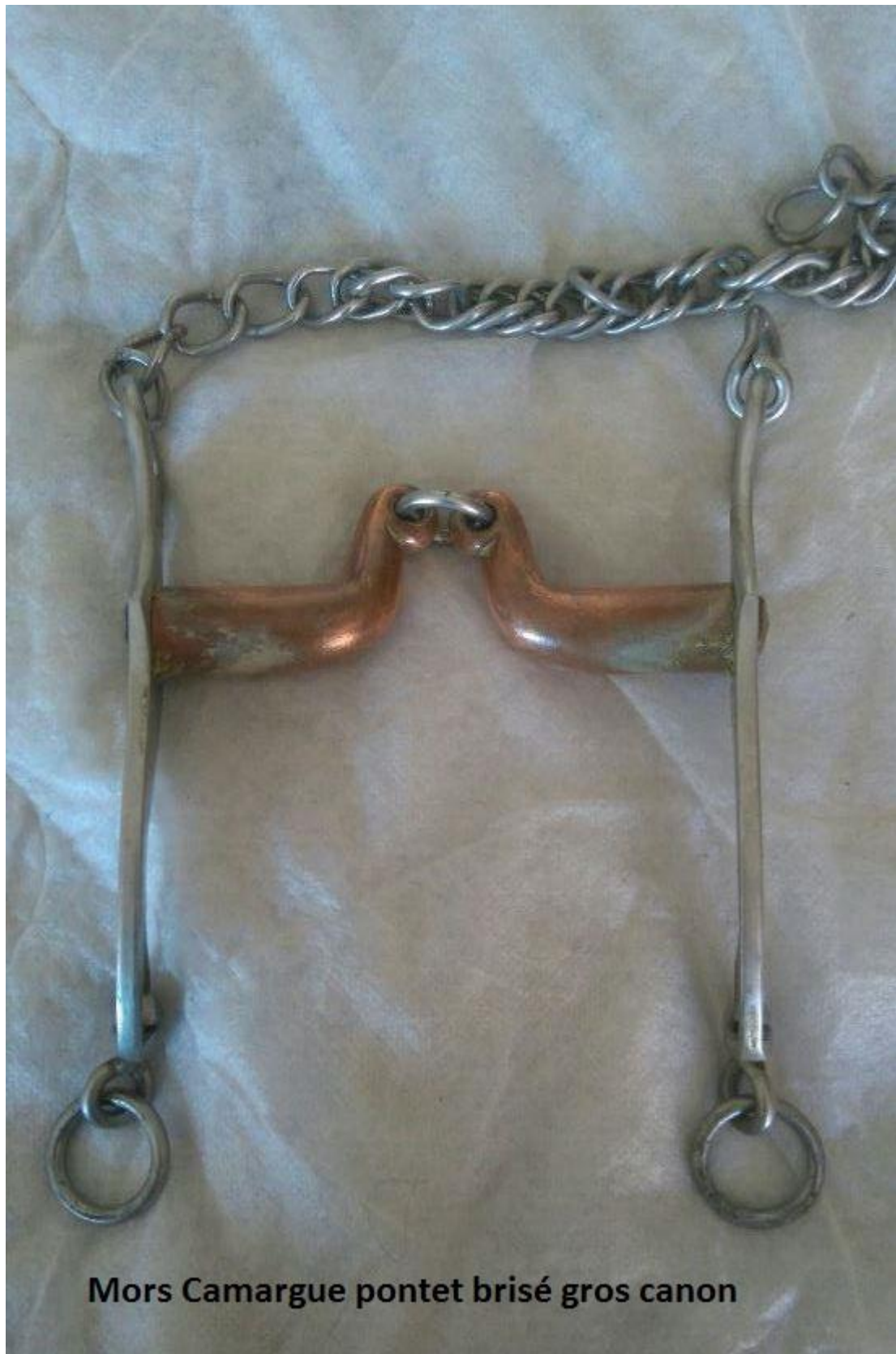
Mors Camargue pontet brisé gros canon