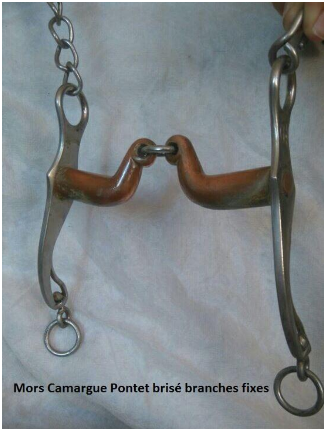
Mors Camargue Pontet brisé branches fixes