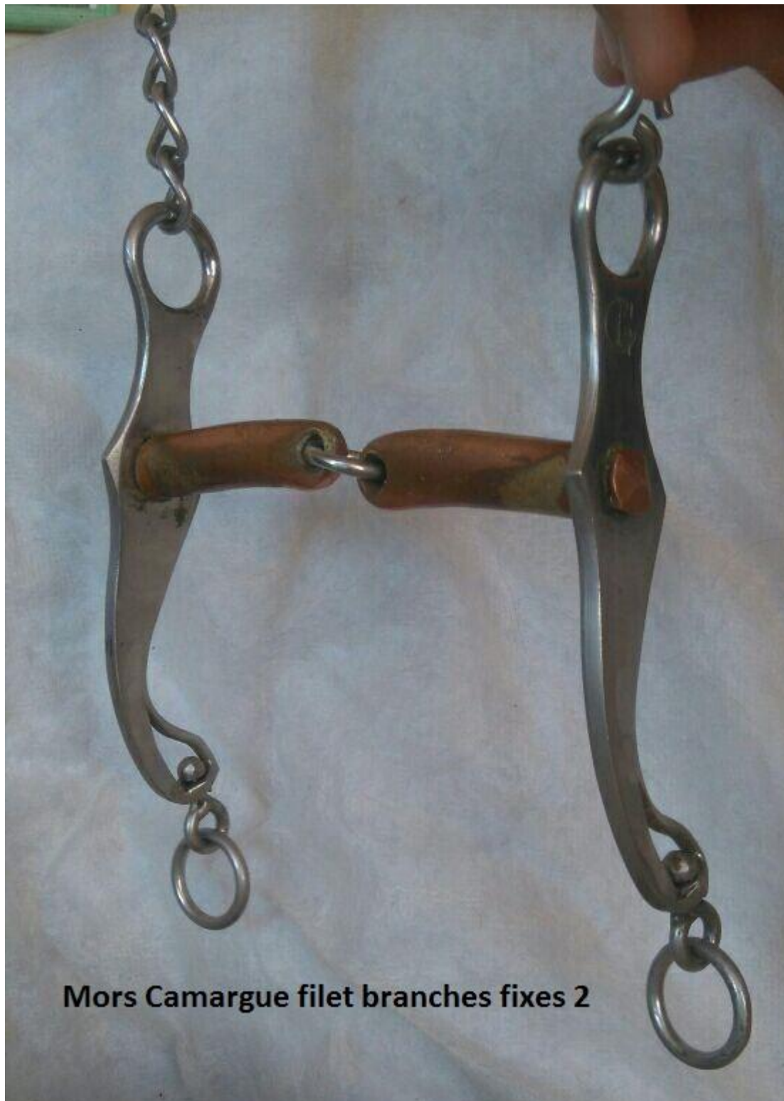
Mors Camargue filet branches fixes 2