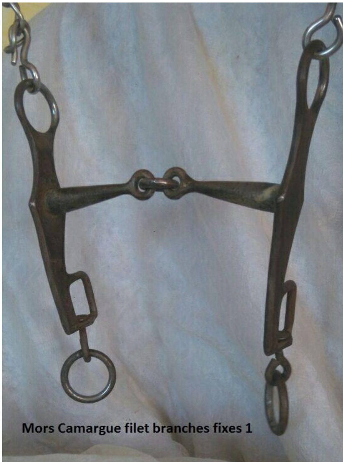
Mors Camargue filet branches fixes 1