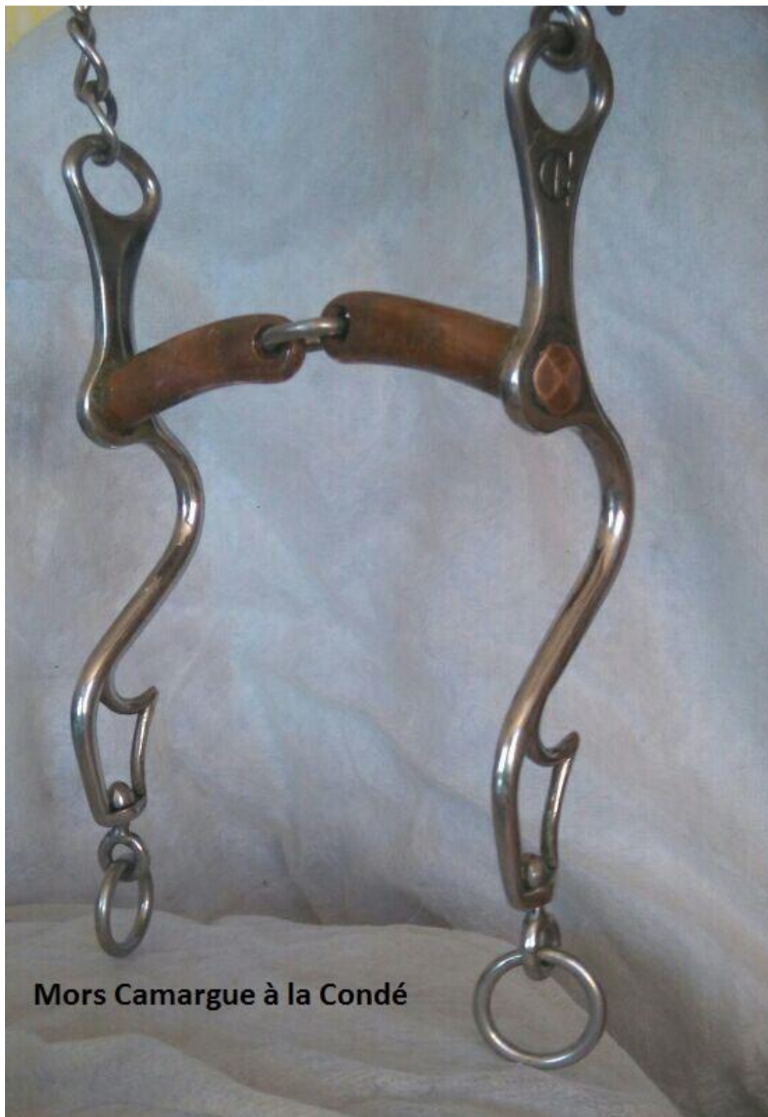
Mors Camargue à la Condé