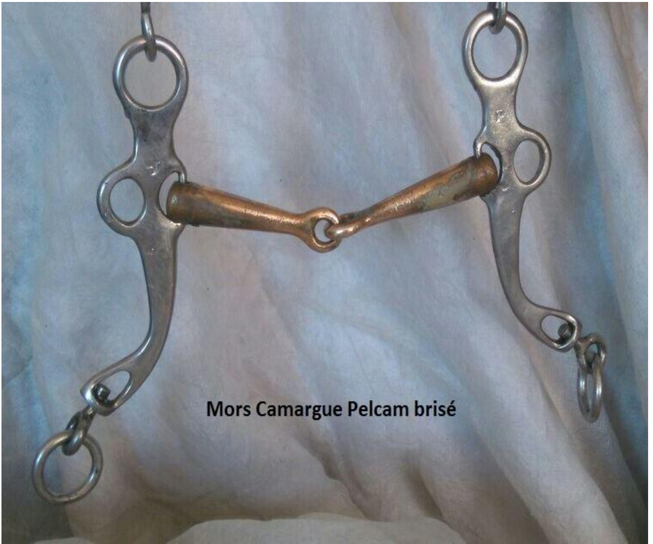
Mors Camargue Pelcam brisé