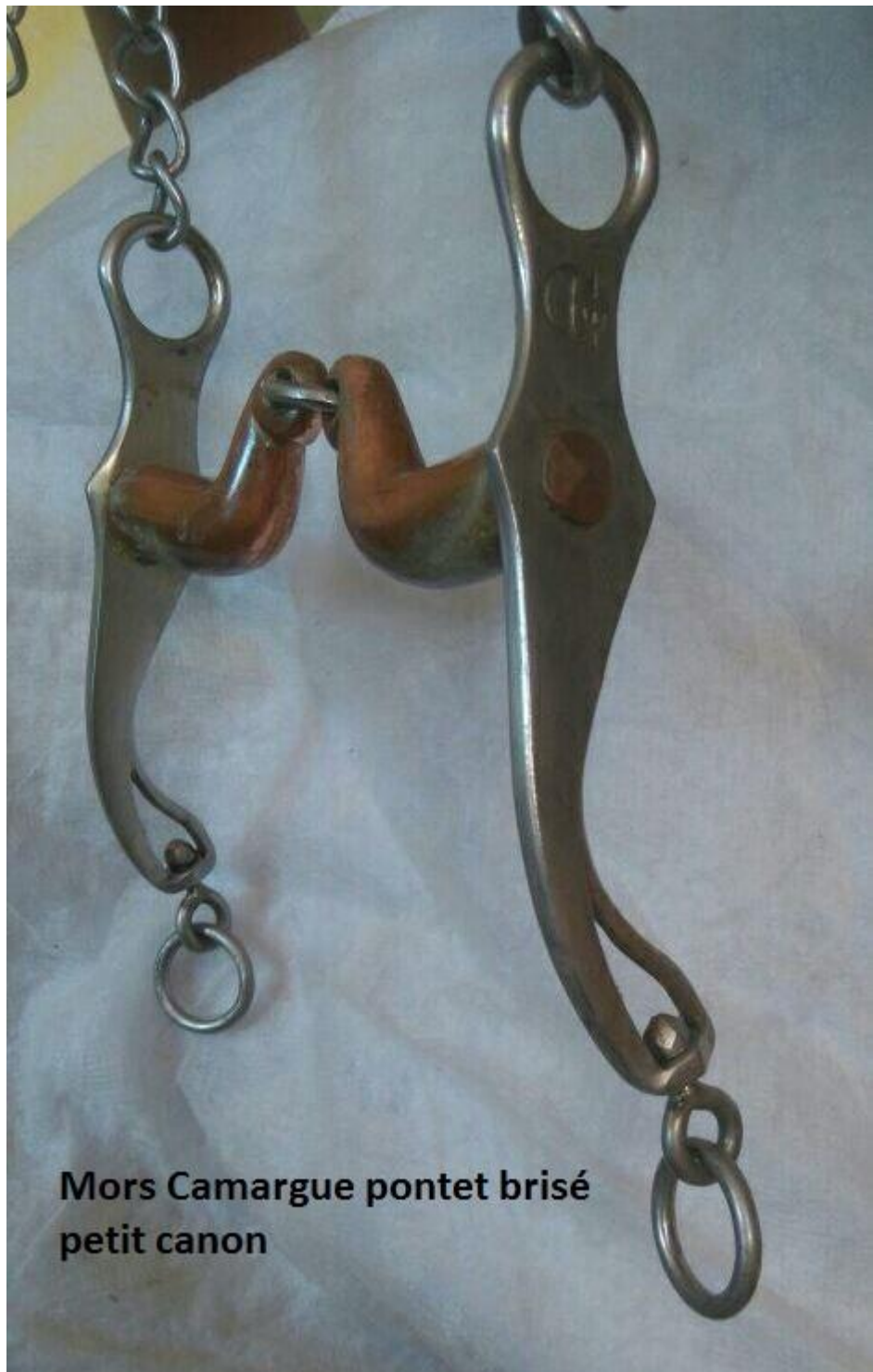
Mors Camargue pontet brisé petit canon