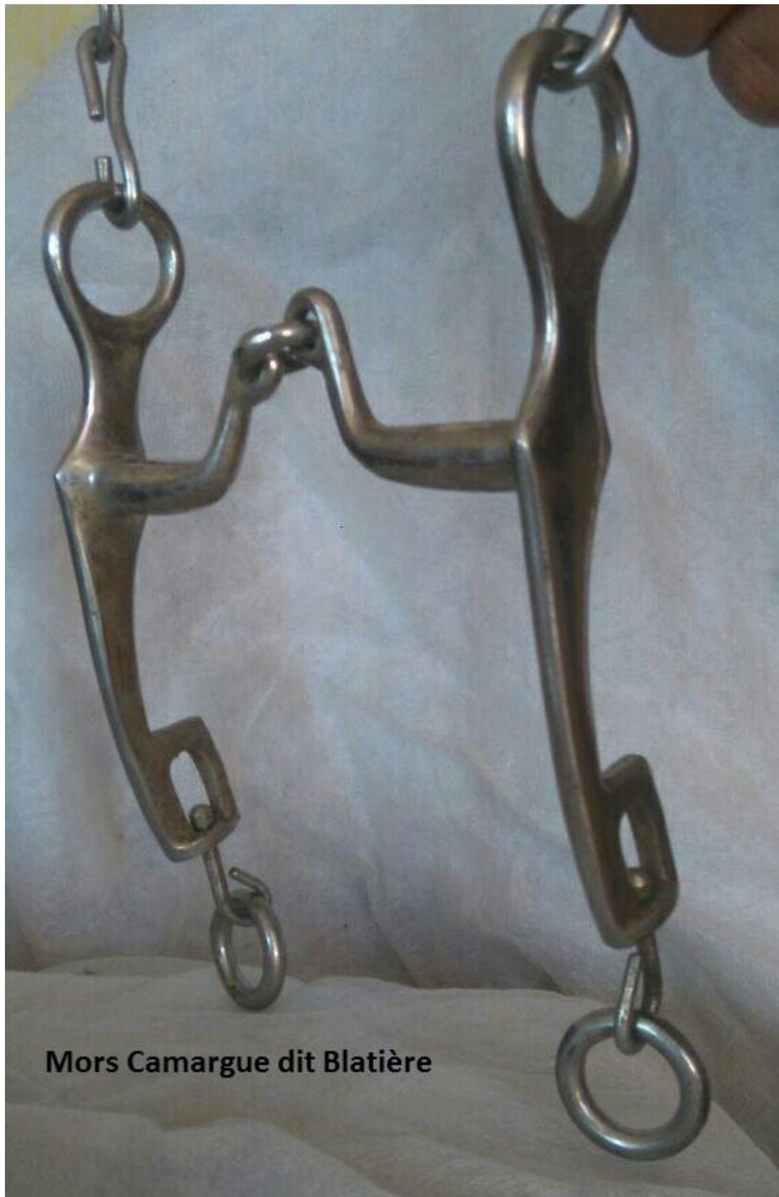
Mors Camargue dit Blatière