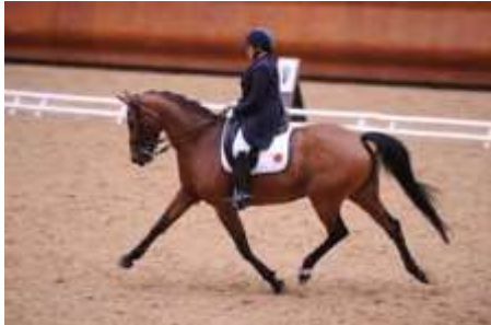
LF 725

Les élèves enseignants et les enseignants se sont donnés rendez-vous les 5 et 6 octobre derniers à l'Ecole Nationale d'Équitation de Saumur pour un championnat placé sous l'égide du sport et de la convivialité. Le National Enseignants s'est déroulé lundi et mardi pour favoriser la disponibilité des enseignants, très occupés le mercredi et le week-end.