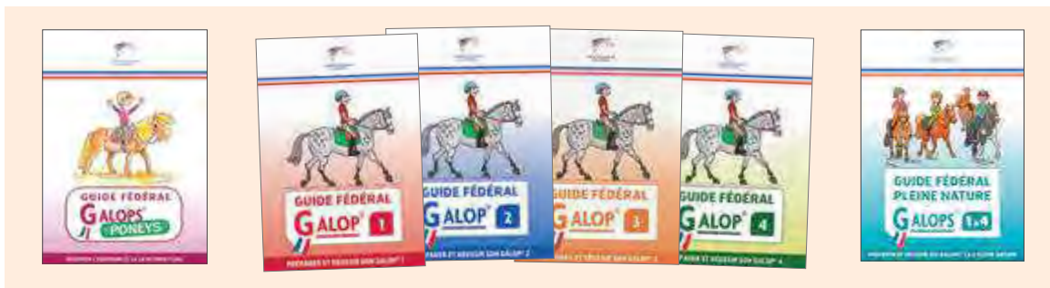
Les Guides sont disponibles dans la boutique en ligne FFE. Tarif préférentiel pour les clubs à partir de 10 exemplaires.

LES DIPLOMES FÉDÉRAUX INSCRIVENT LE CAVALIER DANS UN PROJET DE VALORISATION DE SES ACQUISITIONS. ILS DONNENT DE LA LISIBILITÉ À LA DÉMARCHÉ PÉDAGOGIQUE DE L'ENSEIGNANT. ILS PERMETTENT AU CLUB DE FIDÉLISER D'AVANTAGE.