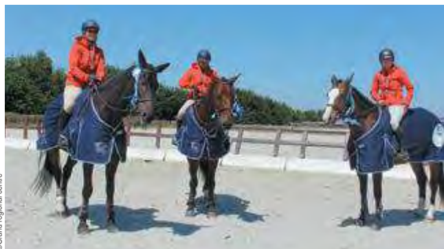
L'équipe victorieuse du Grand Régional Centre

Rappelons que la FFE offre un projet sportif adapté à chaque compétiteur et des circuits d'excellence aux meilleurs. Chaque discipline propose des épreuves dans différentes divisions qui permettent de cibler les publics pour que chacun construise son projet sportif et fasse progresser sa technique en se perfectionnant dans une discipline.