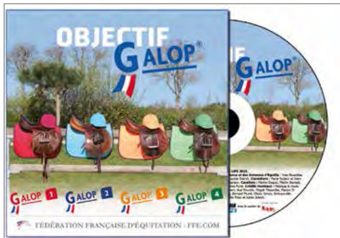
Les 28 films du DVD Objectif Galop® sont aussi sur FFE TV

Les 28 films Objectif Galop® sont disponibles à