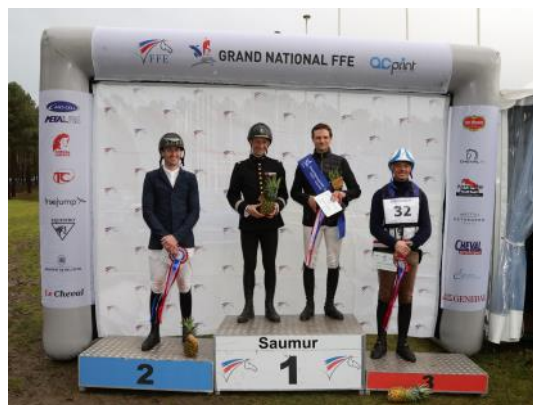
Le podium de la 1 ère étape du Grand National FFE-AC Print.