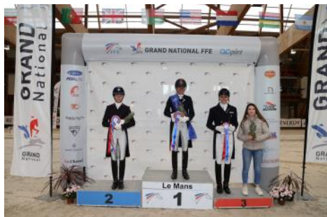
Le podium de la 1 ère étape du Grand National FFE-AC Print.