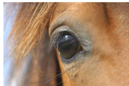
À travers son oeil et sa paupière, le cheval parvient aussi à se faire comprendre.

Par exemple lors du pansage , le cheval envoie de nombreux signaux aussi bien positifs que négatifs selon s'il apprécie ce qu'on lui fait. Comme chez l'être humain, les chevaux peuvent être chatouilleux à certains endroits. Le cavalier devra donc veiller à ne pas s'y attarder. À l'inverse, il ne faut pas hésiter à passer plus de temps sur les zones que le cheval apprécie. Souvent, cela se manifeste par une mimique faciale caractéristique et des lèvres en mouvement qui miment un toilettage mutuel. Le pansage est une étape cruciale puisque c'est là que le cavalier établit le contact avec son cheval. Il lui permet aussi de vérifier si son cheval est en bonne santé aussi bien physiquement que mentalement. Un pansage réalisé dans de bonnes conditions mettra le cheval dans des dispositions idéales pour le travail monté à venir.