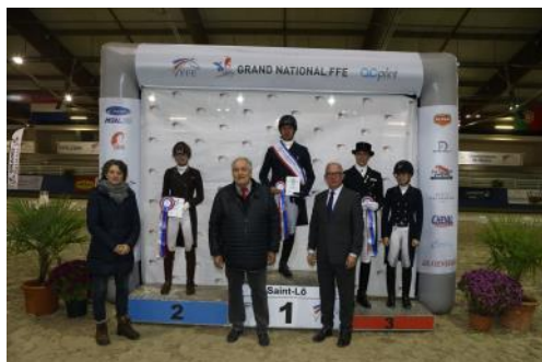
Le podium de la 7 e et dernière étape du Grand National FFE - AC Print.