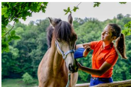
Le cheval sait montrer ce qu'il apprécie ou non lorsque l'on s'occupe de lui.

Les Assises de la filière équine se sont déroulées le 7 novembre 2019 à Angers. Au cœur des préoccupations des Hommes de cheval, le bien-être animal, devenu un enjeu majeur pour l'ensemble de la filière équine, a été au centre des débats.