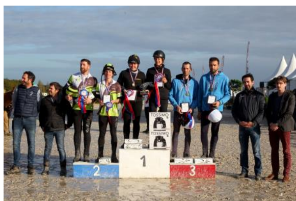
Le podium du Championnat de France Club Élite Seniors.