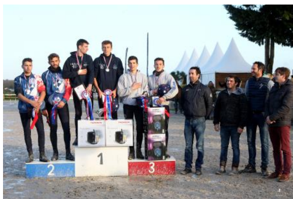
Le podium du Championnat de France Club Élite Excellence.