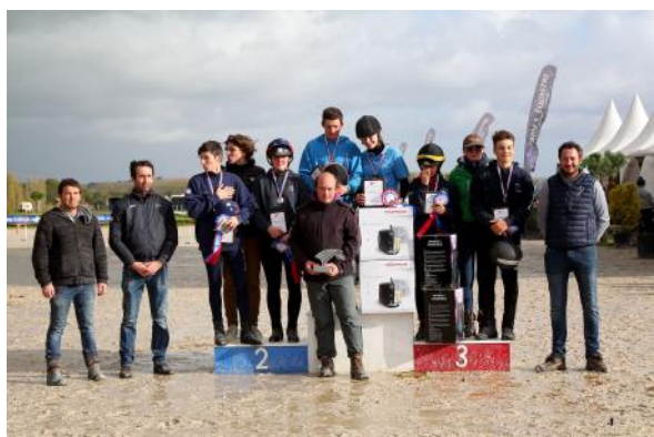
Le podium du Championnat de France Club Élite.