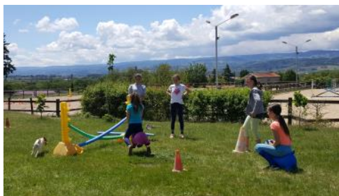
Lors de la Fête du poney de nombreuses animations sont proposées, ici à Equi'Astrée (42).

De nombreux clubs ont proposé des offres promotionnelles à l'image de l'opération « Équitation pour tous » qui permet quelques séances d'essai à un prix réduit. N'hésitez pas à consulter de nouveau le site de la Fête du poney car certaines de ces opérations se poursuivent quelques jours. Le site internet feteduponey.ffe.com permet de trouver en un clic les activités promotionnelles proposées au sein des poney-clubs.