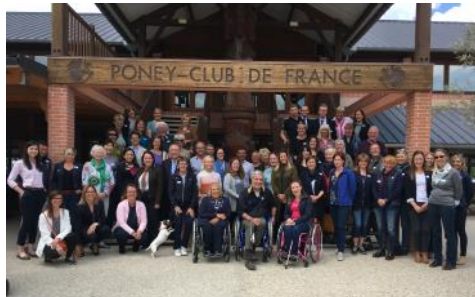
Les participants au séminaire classificateurs et forum FEI.

Du 23 au 26 mai, la FFE a accueilli au Parc équestre fédéral à Lamotte-Beuvron un séminaire pour les classificateurs et un forum FEI autour du para-dressage. Près de 23 nations différentes se sont retrouvées en Sologne afin de réfléchir sur l'évolution de la discipline.