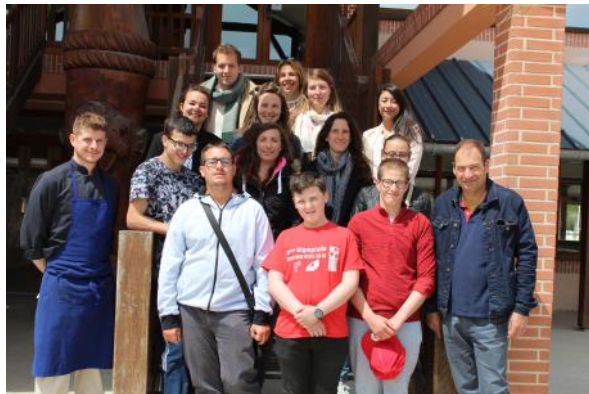
Les jeunes de l'IME d'Herbault et les salariés de la FFE réunis le temps d'une journée.

Le 16 mai 2019, la Fédération Française d'Équitation a participé à l'opération nationale DuoDay. Le but de cette journée est de favoriser l'insertion professionnelle des publics en situation de handicap. Elle s'inscrit dans la démarche Cheval et Diversité de la FFE qui entend accompagner le développement de l'accès à l'équitation pour les publics fragiles.