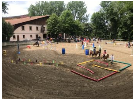
La Fête du poney organisée au poney-club d'Ezanville (95).

Dimanche 26 mai 2019 la 2 e édition de la Fête du poney a battu son plein dans plus de 360 poney-clubs. Cette journée familiale et festive a rassemblé petits et grands autour de leur compagnon préféré : le poney. Organisée concomitamment avec la Fête des mères, la Fête du poney a permis à de nombreuses familles de profiter de cette journée nationale pour aller découvrir l'équitation dans un club participant à l'opération.