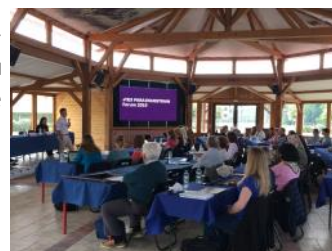
Près de 60 personnes ont assisté au forum FEI.