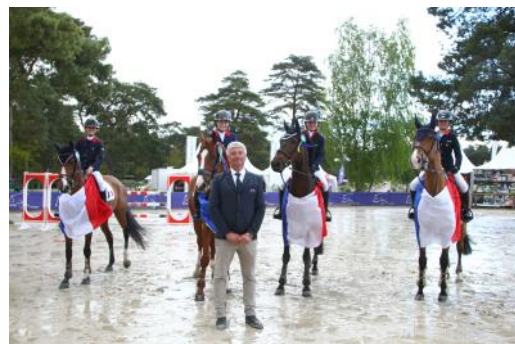
L'équipe de France Enfants termine 3 e ex aequo.