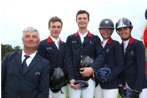
L'équipe de France Jeunes cavaliers finit 2 e .