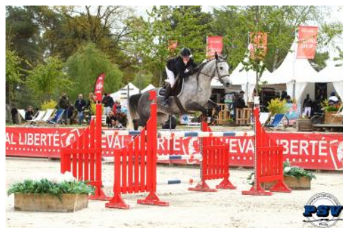
Romane Michelet et Cassina Z.