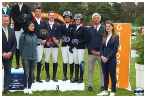
L'équipe de France Juniors 3 e de la Coupe des nations.

Cette semaine, les Bleuets de saut d'obstacles étaient en piste à Fontainebleau (77), sous la houlette du sélectionneur national Olivier Bost. Avec un podium dans chacune des trois catégories représentées, la jeune garde de l'équipe de France affine sa préparation en vue de l'échéance européenne qui s'approche à grands pas.