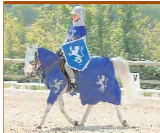
Moderne palefroi.

Il s'agit de la partie bombée du fer à cheval.