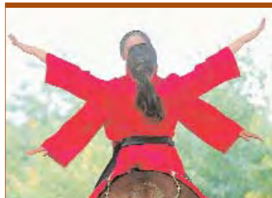
La voltige : simple et spectaculaire.

Côté courses, un plan média d'envergure va créer une convergence de moyens importante pour faire surtout la promotion de la réunion de Vincennes où le tiercé, quarté,