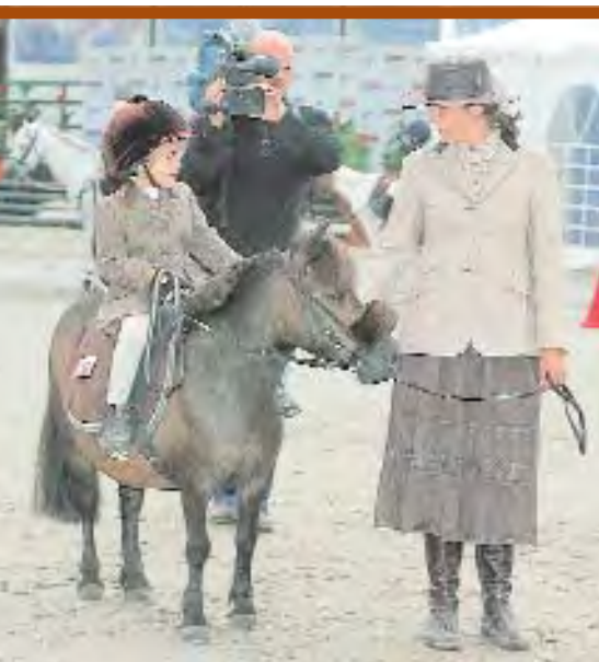
Equidia filmant une belle complicité pendant les mini-hunter lors du Generali Open de France.

La communication commence quand on touche les gens que l'on ne connaît pas et quand on parle de vous dans des supports de communication dont on n'a jamais entendu parler. Autant de bonnes raisons de communiquer tous azimuts.