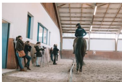
Nicolas Touzaint.