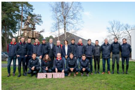
Le staff fédéral et l'équipe de France de concours complet en route pour Tokyo.

Après avoir atteint un premier objectif en qualifiant ses équipes dans les trois disciplines olympiques du concours complet, du saut d'obstacles et du dressage, la Fédération Française d'Équitation s'est mise en ordre de marche pour préparer les Jeux olympiques de Tokyo.