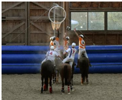
L'équipe d'Angers en blanc face à celle de Meurchin en orange.

Les 16 et 17 novembre derniers, les dix équipes qui composent la catégorie reine du horse-ball français s'étaient donné rendez-vous dans le manège du Pôle international du cheval de Deauville. Sur le terrain, les formations se sont livrées une bataille féroce. Au terme de dix duels intenses, la formation de Loire-sur-Rhône conserve de justesse la tête du classement provisoire.