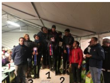
Le podium du Top 7 d'endurance édition 2019.

Après cinq étapes courues tout au long de l'année, le circuit Top 7 s'est achevé sur la 6 e et dernière course comptant pour le classement final à Pamiers. La victoire est revenue à Yullah d'Azat sous la selle de Linda Vaute.