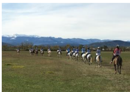
La course du Top 7 de Pamiers.