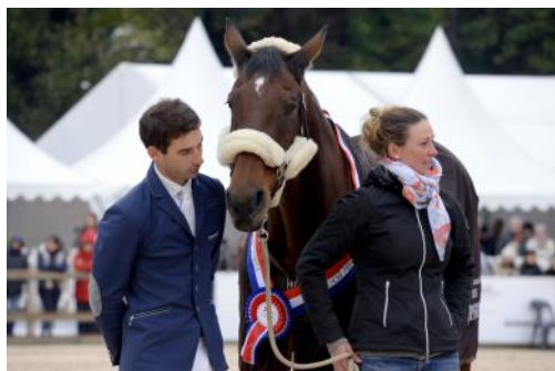
Piaf de B'Neville a eu droit à son jubilé en 2018 à Pau.

Contrairement à l'être humain, il n'y a pas d'âge légal pour la retraite d'un cheval. Qu'il s'agisse d'un cheval de club ou de sport, la retraite se décide au cas par cas selon l'état de santé physique et mental du cheval. Il faut ainsi être attentif aux signes avant-coureurs que l'équidé peut montrer afin de respecter son bien-être. Certaines étapes sont cependant à respecter avant l'arrêt total d'activité pour le cheval.