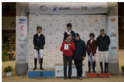
Le podium de l'étape du circuit Grand Indoor FFE - AC Print au Mans.